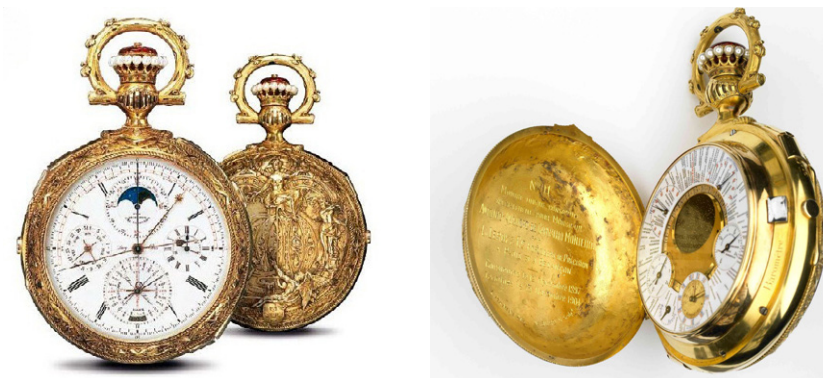
Vista da frente e caixa. | Vista completa do verso aberto.

Esta maravilha da relojoaria, que já ganhara o Grande Prémio da Exposição Universal de Paris em 1900, com uma caixa provisória, e custara a Carvalho Monteiro a fortuna de 20 mil francos franceses de ouro, só lhe seria entregue em 1904, tendo como portador o próprio Rei D. Carlos, que o chamou ao Palácio das Necessidades para lhe fazer a entrega e dar os parabéns pela aquisição desta peça única no mundo, que tanto valorizava o património da nação.